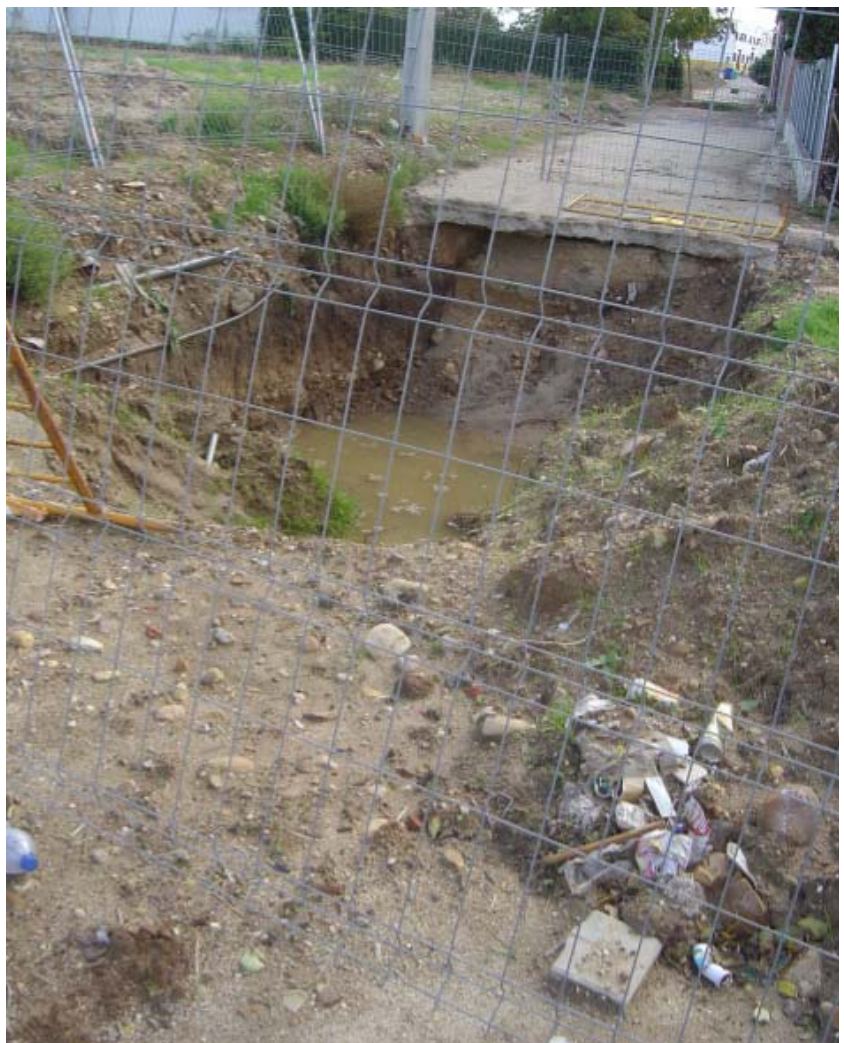
Ir a la piscina o al polideportivo tiene cierto riesgo